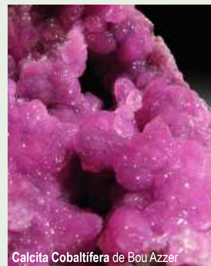
Calcita Cobaltífera de Bou Azzer

ELS ESPECIALISTES EN MINERALS DEL MARROC