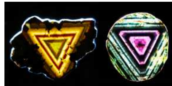
Seccions de Turmalina de l'exposició especial de Sainte-Marie-aux-Mines

Europa. El GMC en té uns pocs exemplars disponibles. Un luxe.