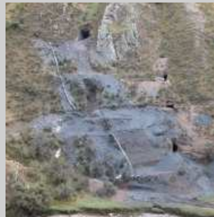
Vista de les galeries de la Mina San Martín

Del PERÚ ens arriben notícies. La Mina peruana San Martín, a Chiuruco, que ha estat donant rodonitas excepcionals, s'ha mostrat gairebé totalment improductiva des del mes de Gener passat. Per aquesta raó, els seus propietaris van prendre la decisió de tancar-la a finals del mes de Juny. Serà difícil doncs que apareguin nous exemplars de rodonita d'aquesta mina en un futur. Pel que ens explicaren les noves vetes de rodonita que apareixien eren compactes i sense geodes que permetessin la formació de cristalls ben desenvolupats. De totes maneres les línies d'explotació ara s'orienten cap la Mina Nuevo Mundo. La mina ja era coneguda per la seva tetraedrita , esfalerita , hübnerita ... (comm. pers. L.M. Fdez. Burillo)