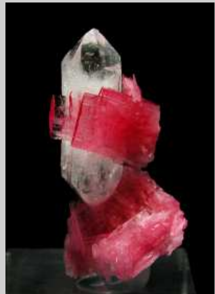
Rodonita. Mina San Martín, Chiuruco, Pallasca, Ancash, Perú. LM Burillo