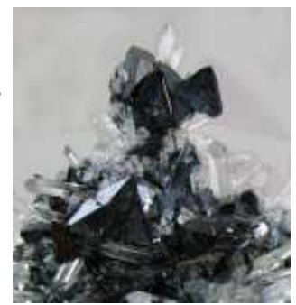
Esfalerita i Quars. Madan, Bulgària Cerussita maclada. Mina Ojuela, Mèxic