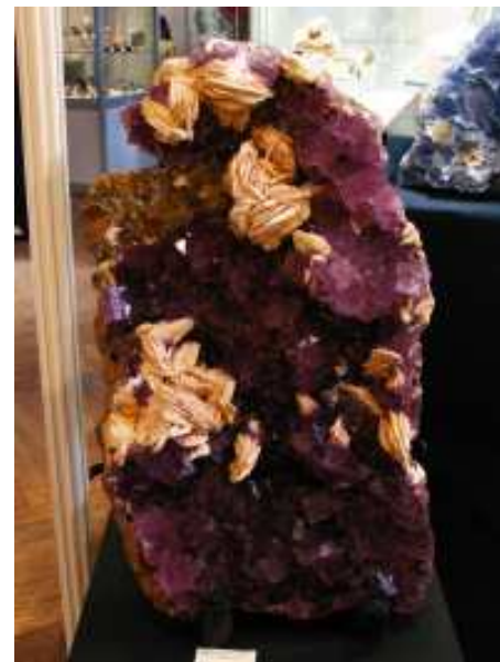
Fluorita i Barita de Berbes, Astúries (65x25 cm)

clàssiques groc-verdoses sobre limonita a preus raonables al costat de wulfenita amb mimetita de la mina Ojuela. De NAMIBIA ens arribaren uns estètics exemplars de shattuckita en una densa matriu de quars, amb malaquita i crisocol·la . Les ja conegudes fluorites d'Erongo han millorat la seva qualitat i les hem vist com a cubs truncats als vèrtexs amb zonacions de color molt geomètriques i disposats sobre ben definits cristalls de quars fumats. D' ESpanya citar una enorme fluorita amb barita de Berbes de 65x45x25 cm, una bonica placa. També en un stand d'un estranger que sol venir a picar per la península unes bones goethites acolorides...pero encara per netejar. Destacar entre els minerals de CATALUNYA la ferrosaponita de Maçanet de la Selva, de les que parlem en una nota. També es van veure celestines de Torà. D'altres minerals que mereixen la pena citar-se són les noves brookites transparents de color intensament marró de fins a 2,5 cm amb anatases associades procedents de