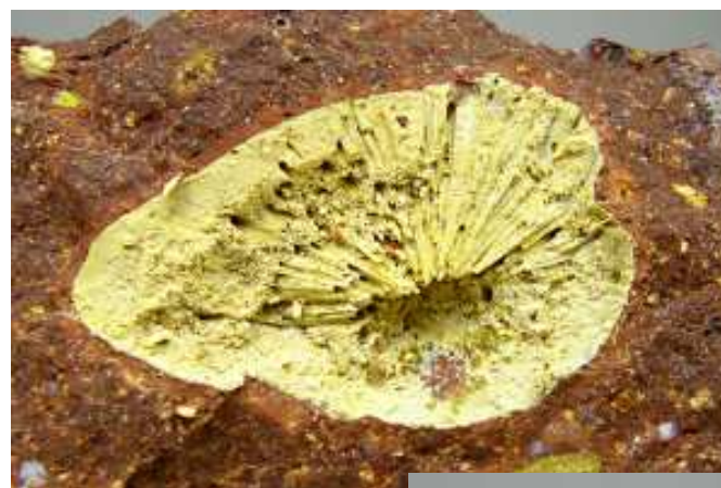
Dalt. Vacuola de Ferrosaponita. Dreta. Ferrosaponita amb Hollandita. Pedrera Guixeras, Can Súrria, Maçanet de la Selva, Girona.