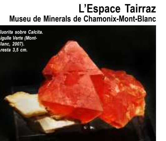
L'Espace Tairraz Museu de Minerals de Chamonix-Mont-Blanc

Fluorita sobre Calcita. Aigües Verdes (Mont-Blanc, 2007). Aresta 3,5 cm.