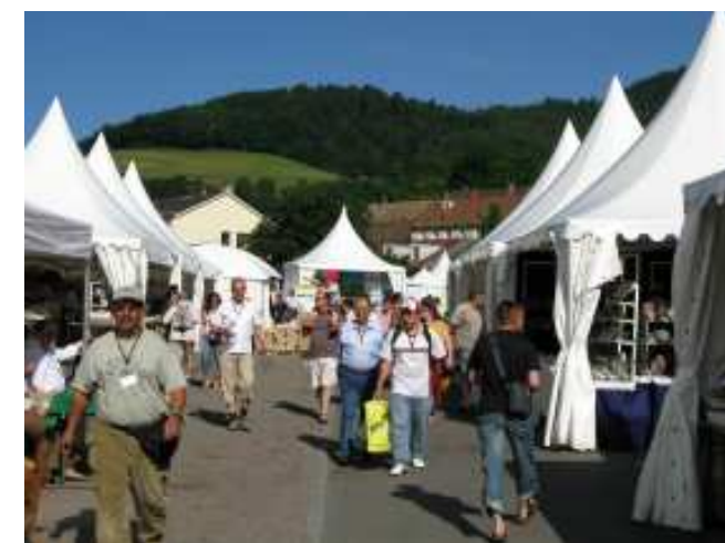
Els carrers de Ste. Marie amb compradors i venedors i alguna que altra taverna.

Pel que fa al material vingut del MARROC destacar per una banda els excelents agregats d' acantita molt més llustrosos del que és habitual. Una de les espècies que ha millorat! Agregats arborescents de cristalls pseudooctaèdrics de tamany considerable, de fins a 2 cm. No eren pas tractats amb àcids ni polits a mà, ja que s'observaven delicats creixements que d'altra manera s'haguéssin destruït i alguns exemplars eren portadors de proustita ben vermella. Parlant de l'acantita, ens confirmaren alguns marroquís que cal anar amb compte amb algunes de les plates esfilagarsades que provinents d'Imiter es venen com a naturals i en realitat han estat fetes en laboratori. Podeu trobar un excel·lent estudi demostratiu al blog del nostre benvolgut amic Joan Abella