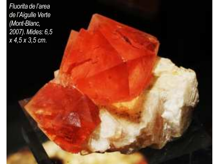
Fluorita de l'area de l'Aiguille Verte (Mont-Blanc, 2007). Mides: 6,5 x 4,5 x 3,5 cm.

www.chamonix.fr/animationculture/site_museecristaux/accueil.html